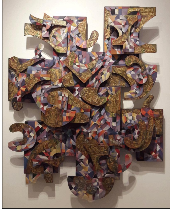
شكل رقم (١) أحد أعمال الفنان عبد الرحمن النشار، يمثل علاقة عضوية وهندسية، ١٩٩٩، وسائط متعدد الألوان. نقلًا عن:

والشكل رقم (١) للفنان "عبد الرحمن النشار" (*) (A. Nachar) (١٩٢٣-١٩٩٩) يوضح كيفية إضافة بعداً جديداً إلى البعدين المتعارف عليهما (الطول والعرض) من خلال تجسيم مسطحاته، وإضافة بعض البروزات والتجاويف والانبعاجات، التي ينتج عنها ظلال طبيعية غير ثابتة تتغير بتغير مصدر الضوء الملقى عليها، وبذلك تزداد اللوحة ثراء وتكتسب حركة نسبية تضاف إلى سكونها.