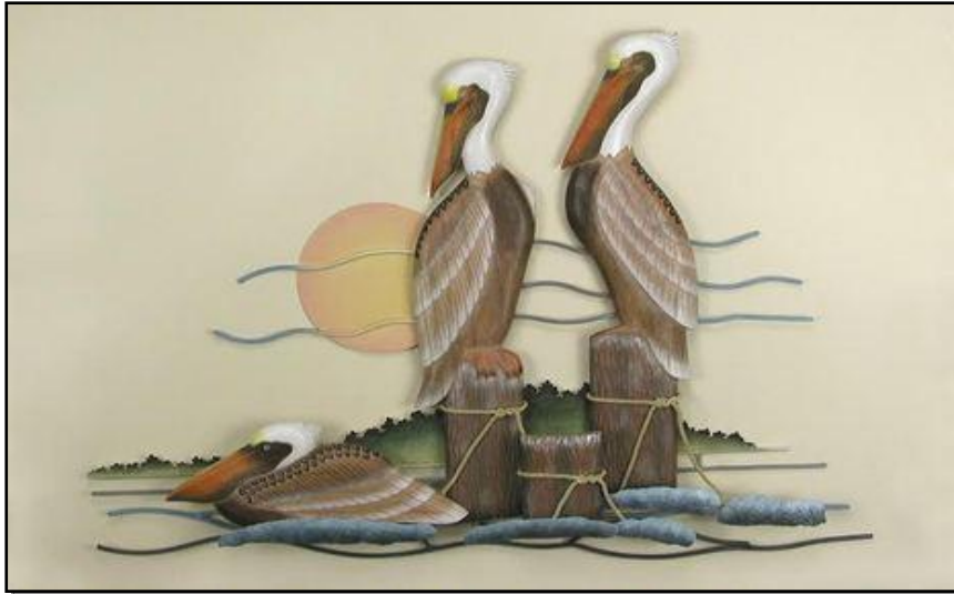
شكل رقم (١٢) احد اعمال الفنان "جوان فيرارا" (Joanne Ferrara)، خشب ومعدن وجلد طبيعي، البجع ٣، ٢٠١٠، ٤٢×٣٠×٤ بوصة، مجموعة خاصة بالفنان. نُقلا عن:

ولقد كان لتنوع زوايا واتجاهات الرؤية المستقيمة والمائلة، والمنحنية مع حركة الخطوط مساهمة في توفير ديناميكية القيم والحوارات التشكيلية، وتحفيز الأبصار والأذهان على تتبع مسارات القيم الجمالية بين أجزاء وعناصر ومستويات التكوين.