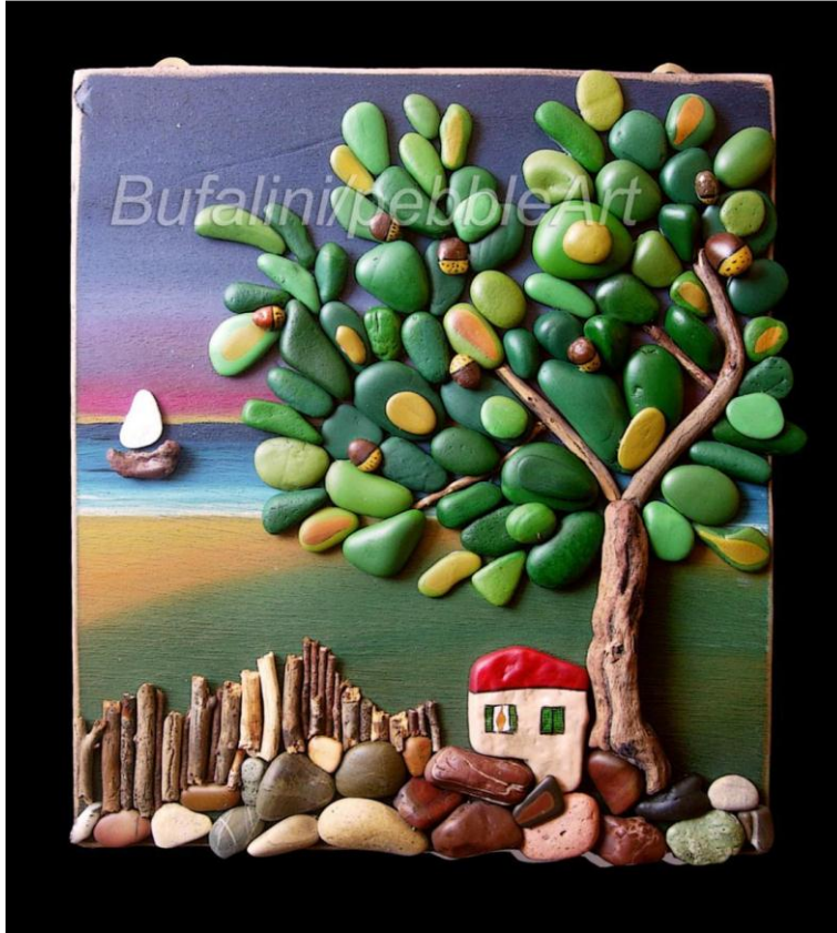
شكل رقم (١٠) مشغولة فنية للفنانة " ميشالا بوفاليني " (Michela Bufalini)، تجميع، ٢٠١٥، خامات متنوعة وزلط وأحجار وخشب، ٣٥ × ٣٠ × ٥ سم، مجموعة خاصة بالفنان. نقلًا عن: (AmeSea Database - ae - January - A)

كما كان لاستخدام أسلوب التراكم الكلى والجزئي للأشكال والهياكل في مستويات متباينة الأبعاد ومتنوعة الحجم واللون والفراغ أثراً واضحاً في إكساب المشغولة بعداً جديداً للطاقة من خلال المساحات الظلالية وما يقابلها من مساحات أخرى والمتمثلة في فضاء الخلفية في تأثير درامي للحركة.