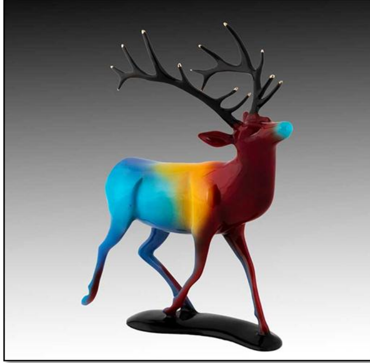
شكل رقم (٢) أحد أعمال الفنان روبرت ديورلو (Robert Deurloo)، النسخة المائة، برونز، ١٠×٩×٤ بوصة، ٢٠١٧.

ومن ناحية أخرى نجد أن فن النحت قد استفاد هو الآخر من أساليب التصوير والتصميم ويتضح ذلك من خلال الشكل رقم (٢) للفنان " روبرت ديورلو" (*) (Robert Deurloo) (١٩٤٧ - ) الذي استخدمت فيه مجموعة من العلاقات اللونية المتنوعة على الأجزاء المختلفة للتمثال وكأنها درجات لونية لمجموعات متداخلة.