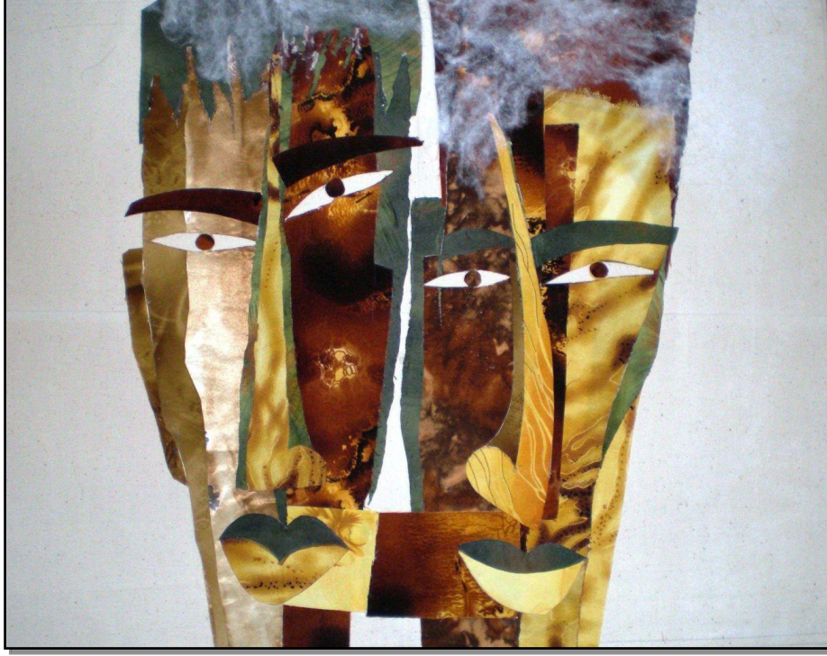
شكل رقم (٦) مشغولة فنية للفنان، "محمود حامد" (Mahmoud Hamed)، إنسان، ٢٠٠٨، بقايا أقمشة، ٥٠ × ٧٠ سم، مجموعة خاصة بالفنان. نقلًا عن: الفنان.

ولقد لعب اللون والمظهر السطحي للقماش الذي يشبه ضربات الفرشاة دورًا إيجابيًا في إكساب المشغولة بعدًا دراميًا جديدًا أظهر الفنان من خلاله قيمة الإيقاع من حيث التردد الجيد والتوزيع المحكم للألوان الداكنة والفاتحة والساخنة والباردة والذي أثر بدوره في زيادة الإحساس بالحركة المتجهة من الداخل إلى الخارج أو العكس بصورة متتابعة تزيد من فاعلية للعناصر المستخدمة في بناء المشغولة في تناسب وتوافق.