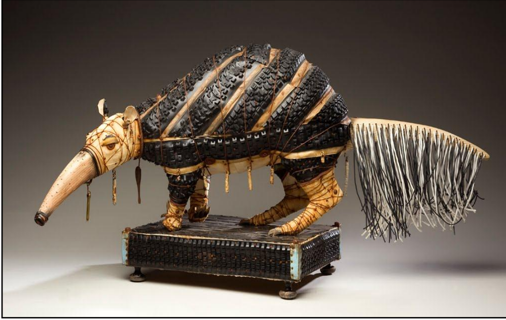
شكل رقم (٥) مشغولة فنية للفنان "جيفري جورمان" (Geoffrey Gorman)، آكل النمل يستعد للنهب، ٢٠١١، خشب وقماش وجلد ومعادن، وأشباه مهيمة، ٢٢ × ٤٤ × ٧ بوصة، جاليري جين سوير، نيويورك.

ولقد لعب التوليف بين الخامات المتنوعة بألوانها المتنوعة دوراً إيجابياً في إكساب المشغولة بعداً درامياً أكده الفنان من خلال قيمة الإيقاع والترديد المنتظم للخطوط السوداء على البدن والتوزيع المحكم للتقنيات، والذي أثر بدوره في تحقيق التوافق بين أجزاء المشغولة في إطار من النسبة والتناسب فيما بينها والذي أضفى عليها نوعاً من تعادل القوى زادت من القيمة الجمالية لها.