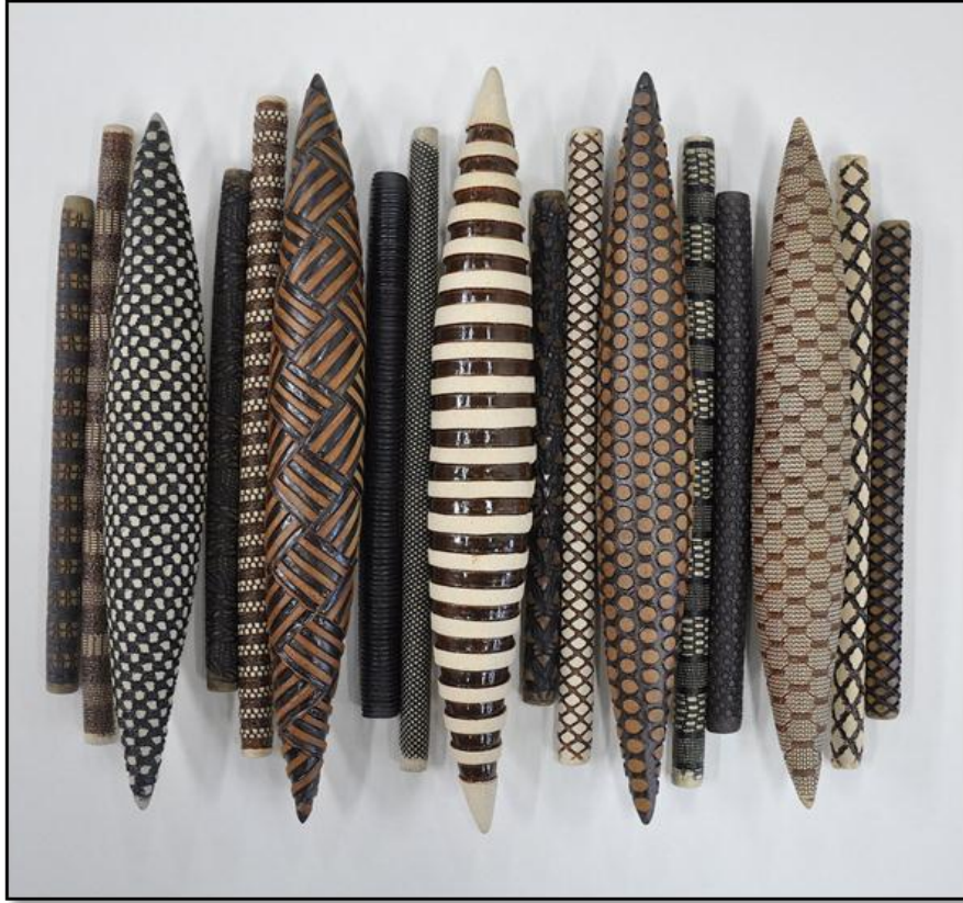
شكل رقم (3) أحد أعمال الفنان كيلي جين (Kelly Jean)، السفينة، خزف حائطي، ١٨×١٧×٢ بوصة، ٢٠١٧. نقلًا عن: https://www.artfulhome.com/product/Ceramic-Wall-Art/Domestic-Markings